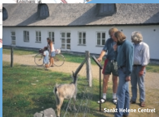
Sankt Helene Centret